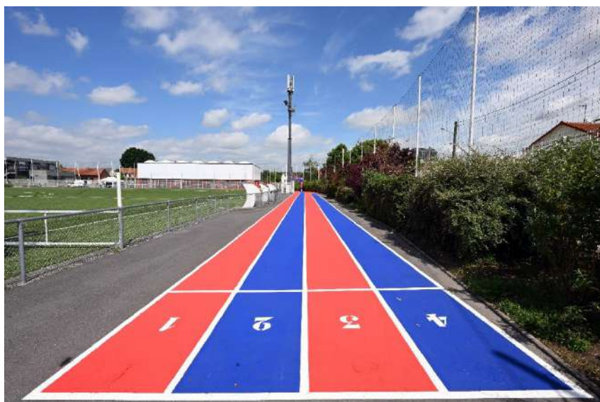
Piste d'athlétisme de proximité – Tremblay (93)