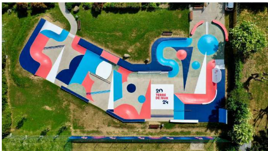
Skate-park - Pontoise (95)