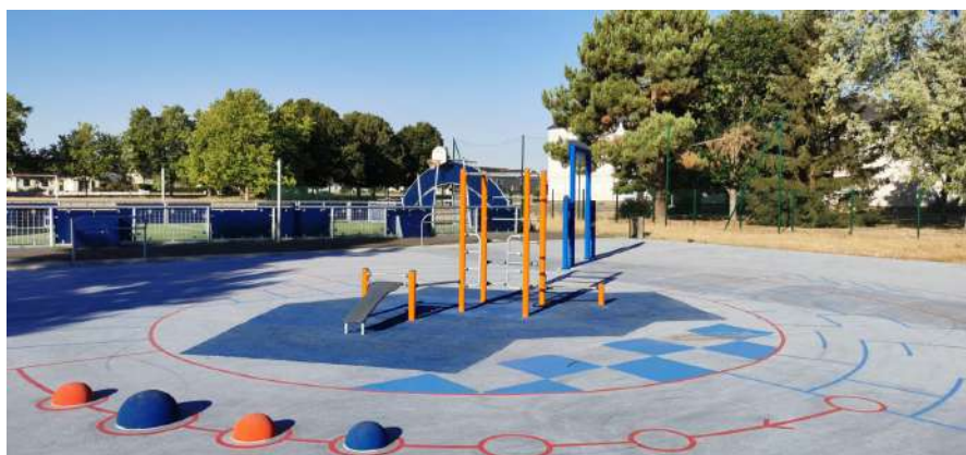
Aire de Fitness - Le Lude (72)